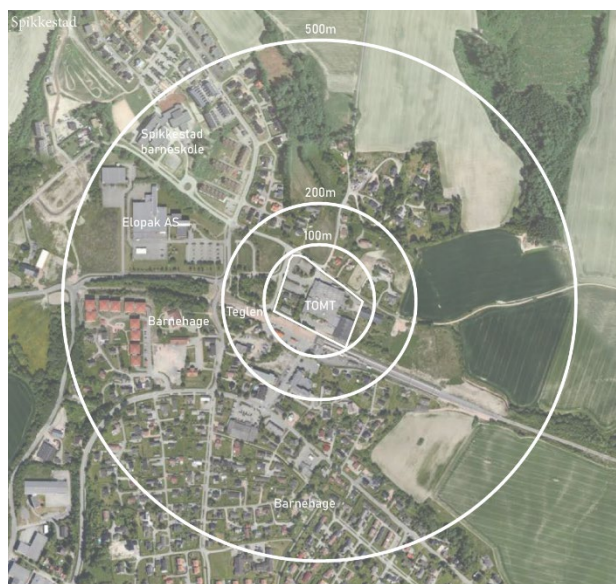
Figur 1 Utzoomet kart som viser plasseringen av området i større Spikkestad-kontekst